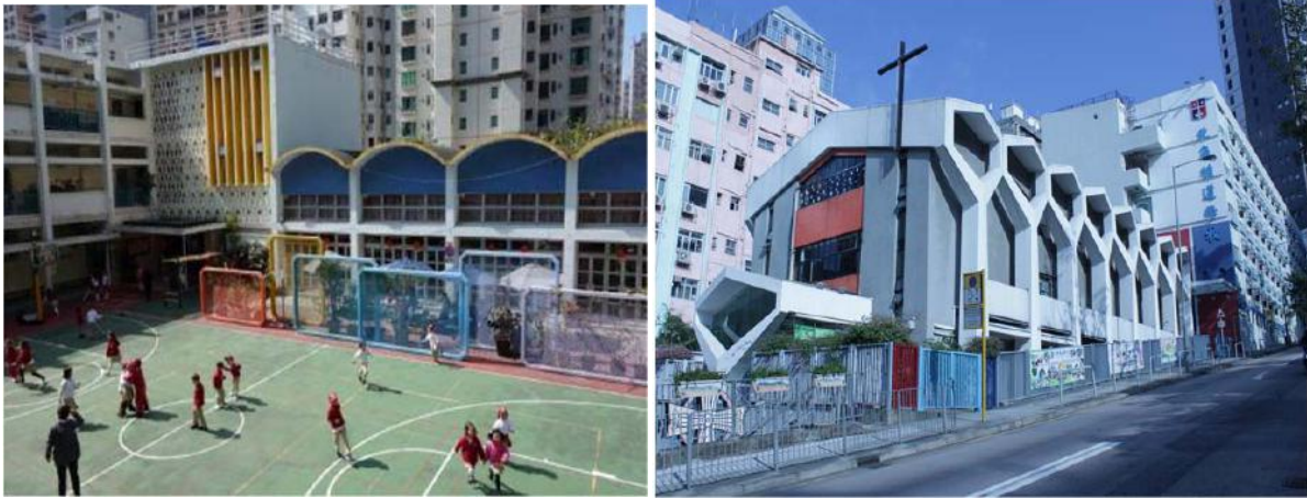
圖十二：前建造商會學校（左）及 循道衛理聯合教會北角堂（右）