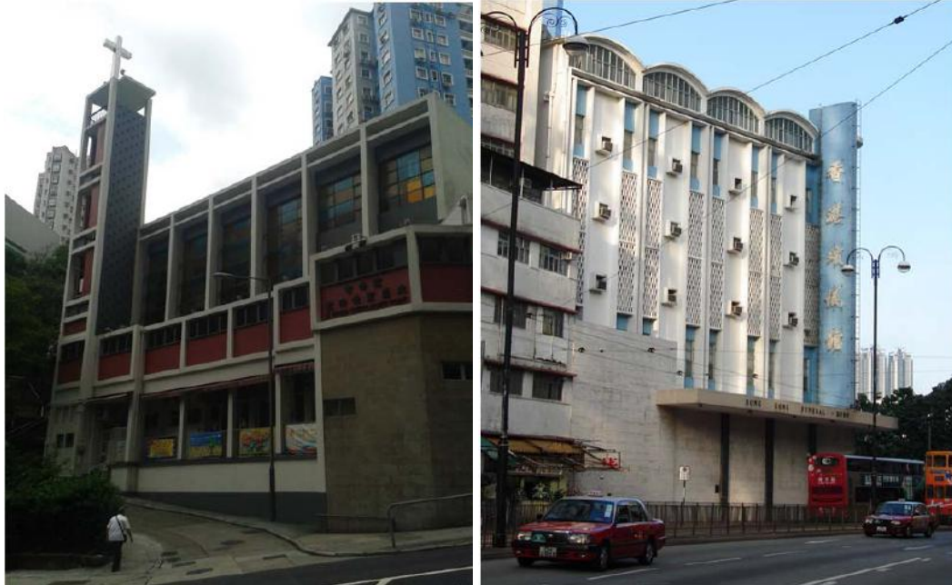
圖十一：聖公會北角聖彼得堂（左）及香港殯儀館（右） （圖片來源：私人照片）

（麗池花園大廈圖片來源：Edward Denison, Luke Him Sau, Architect: China's Missing Modern , p.222）