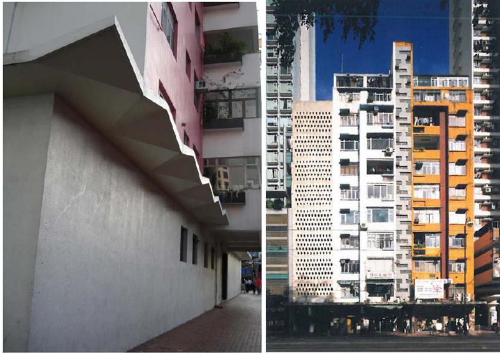
圖十：寶石樓（左）及 麗池花園大廈（右）