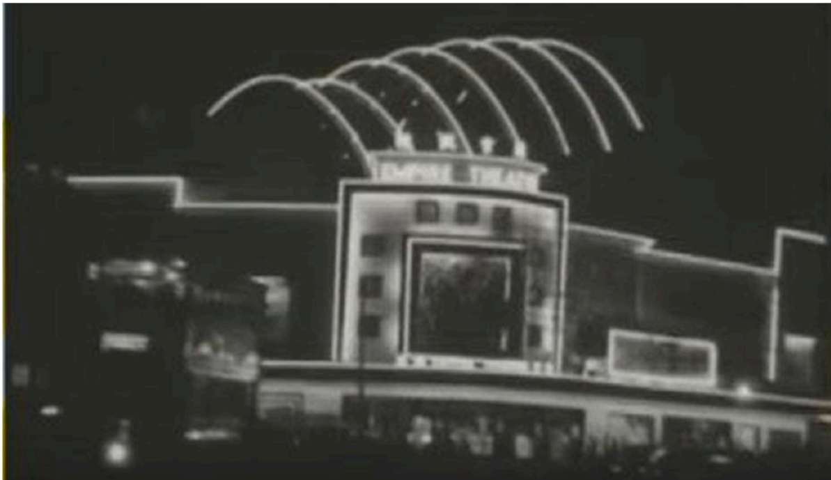
圖八：1953年八月上影的《再戀負心人》第一幕的情景