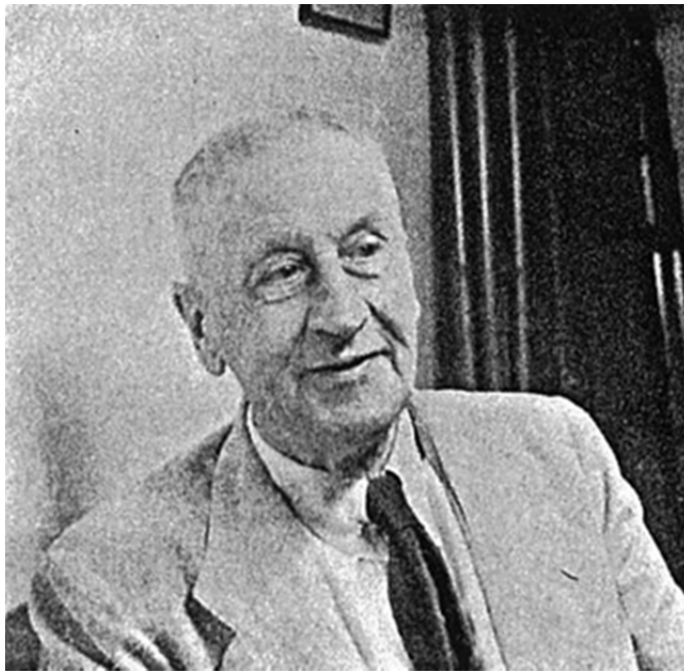
圖四：璇宮戲院其中一位建築師 - George.W. Grey