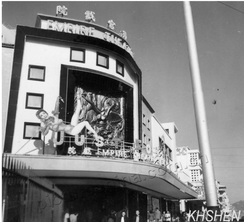
圖六：1952年「蝶戀花」的大型浮雕裝飾