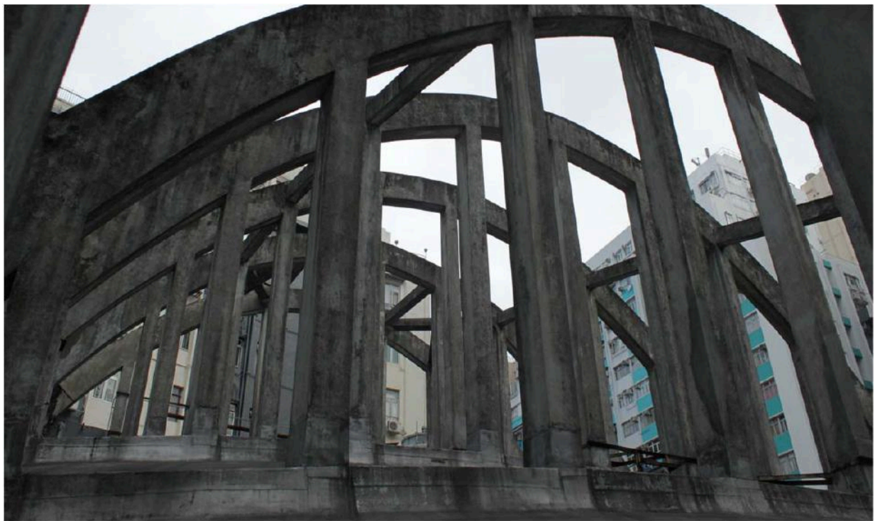
圖七：屋頂上建有亞洲罕見的外露式拋物線型桁架