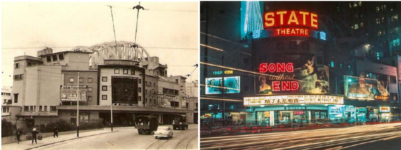
圖五：1952年璇宮戲院主要立面（左）；1960年皇都戲院晚上的盛況（右）